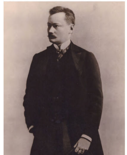
Sándor Korányi, Professor der inneren Medizin 1866-1944