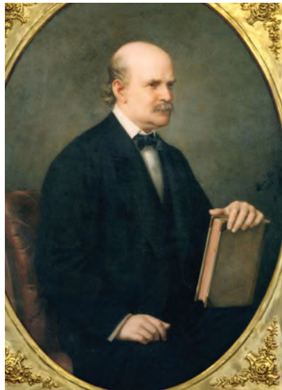
Ignác Semmelweis auf dem Gemälde von Mór Than 1818-1865