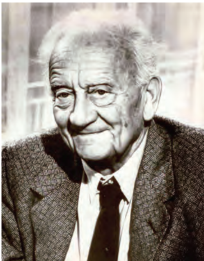
Albert Szent-Györgyi, Nobel-Preis- Träger, Professor der Biochemie 1893-1986