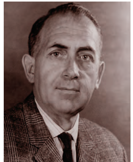
János Szentágothai, Hirnforscher, Professor der Anatomie 1912-1994